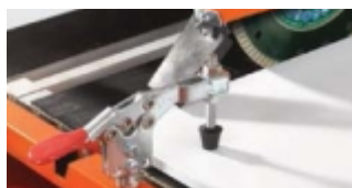
CLEME REGLABILE PENTRU FIXAREA PLACILOR