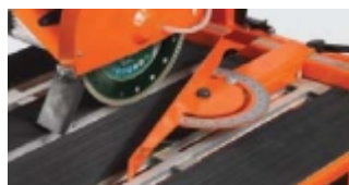
GHIDAJ UNGHIULAR / MASA ACOPERITA CU CAUCIUC